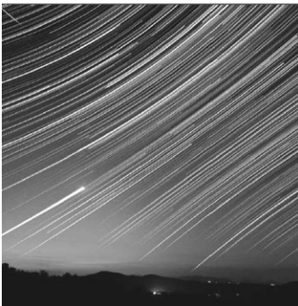
Langzeitaufnahme des Sternhimmels, mit der Bahn der Venus unten links

Neben einer systematischen Herleitung der Entstehung der Planeten-Bewegungs-Bilder werden wir auf die geschichtliche Entwicklung der Astronomie und der durch sie geprägten Weltbilder eingehen.